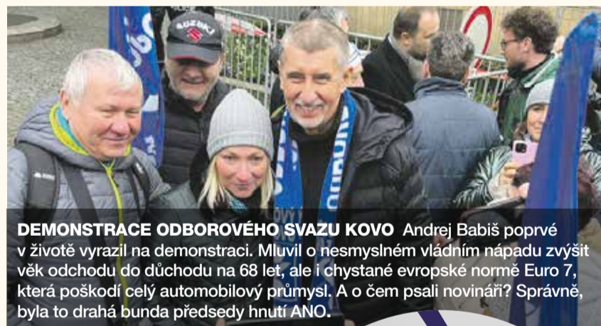
DEMONSTRACE ODBOROVÉHO SVAZU KOVO Andrej Babiš poprvé v životě vyrazil na demonstraci. Mluvil o nesmyslném vládním nápadu zvýšit věk odchodu do důchodu na 68 let, ale i chystané evropské normě Euro 7, která poškodí celý automobilový průmysl. A o čem psali novináři? Správně, byla to drahá bunda předsedy hnutí ANO.

A co snížení daní z hazardu? To dělají pro koho? To je přeče skandální. Každý to vidí v přímém přenosu. Na jedné straně řeší, jak zvýšit DPH u těch nejcitlivějších položek, jako je vodné a stočné, léky nebo teplo, a zároveň přijdou s tím, že sníží daně z hazardu? To je na-